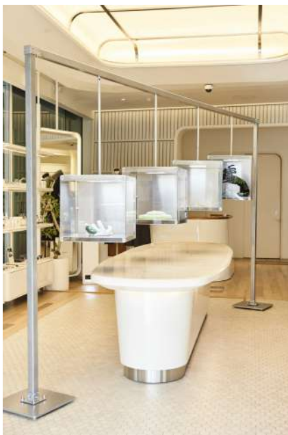
2020년 삼성물산 하이퀄리티 패션브랜드 KUHO와의 콜라보레이션 전시 기획