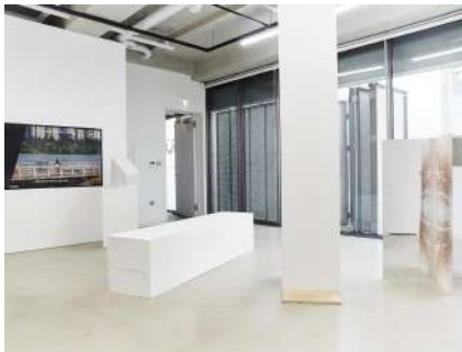
패션브랜드 루이까폴트의 컨템포러리 아트센터 플랫폼엘에서 전시 개최