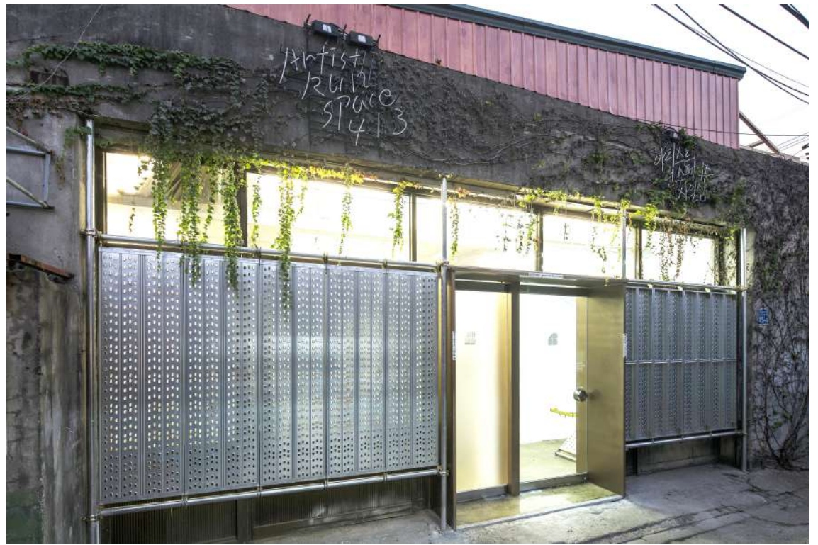
Art space 공간사일삼 외부모습

공간 사일삼은 2009년부터 현재까지 1000여 명의 아티스트와 관계 맺으며 대한민국 서울의 핵심적인 문화공간으로 자리 잡고 있습니다.