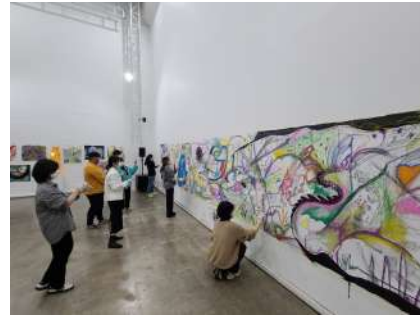
2020년 서울문화재단 시민예술대학 창작워크숍 프로그램 진행