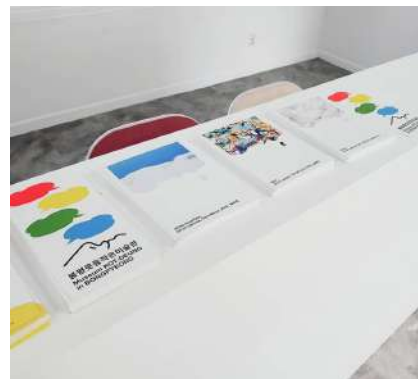
봉평 콧등 작은 미술관 설립 컨설팅 및 기획