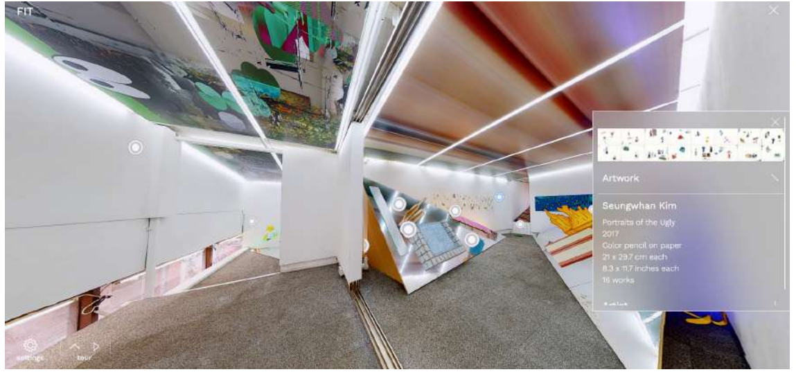
3D 전시 기록 및 VR 전시 콘텐츠 (@eazel)