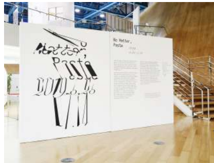
인천 복합문화공간 트라이볼에서 기획전시 유치