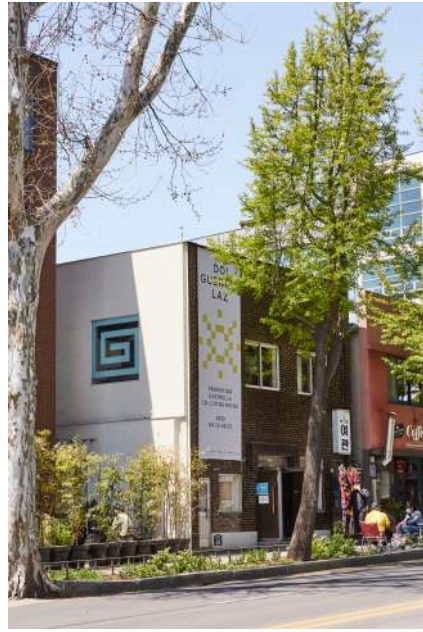
청년 주거 모델을 제안하는 Co-living 스타트업 게릴라즈의 프로모션 전시 기획