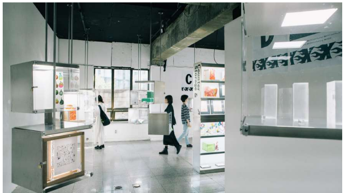
3회 아트페어 <2019 PACK: 모험! 더블 크로스> 현장 이미지