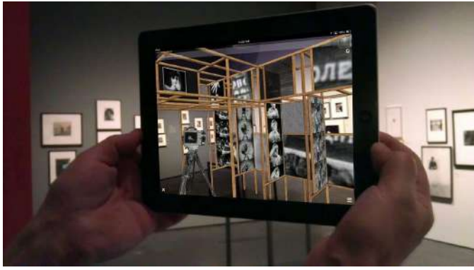
AR 작품 관람 APP (참고 사례)